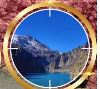
GUPIS ATTABAD LAKE